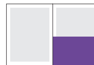
1/2 полосы, 1/2 обложки